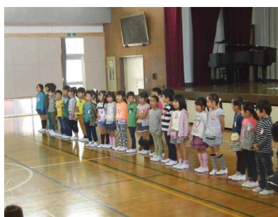
【1年生仲間入りの言葉】