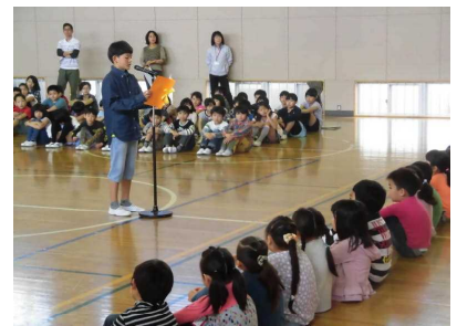
【児童会長歓迎の言葉】