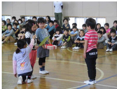
【2年生からのプレゼント】