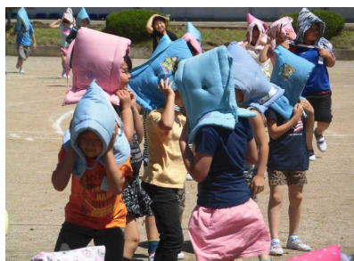
【防災頭巾で頭を保護】