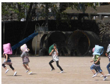
【続々と避難場所(南門前)へ】

正しい避難の仕方をしっかりと身に付けて、いざと云う時に完璧に生かせることを期待しています。