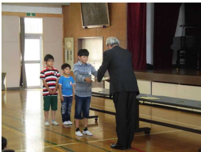
【 1年生にバッジ授与 】