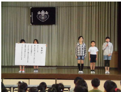
【 「ちかい」の言葉を唱和 】