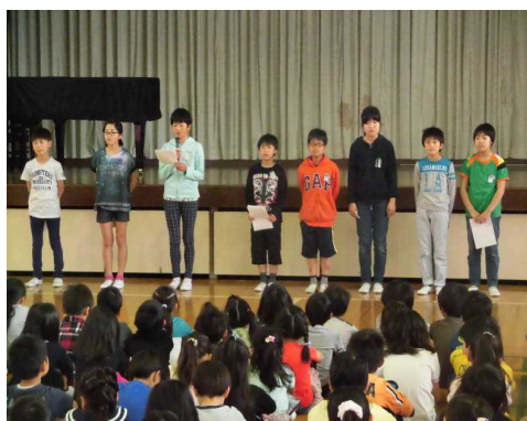
【各委員会の代表から】