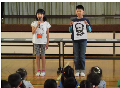
【 JRC についての話 】