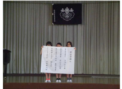
【 『空は世界へ』 斉唱 】