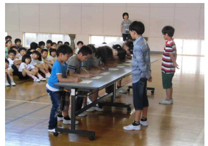
【 学級代表による署名 】