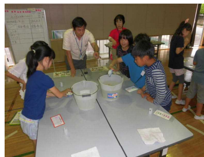
【醤油を使って水の汚れを比較】