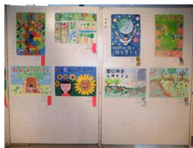
【緑と花のポスター展】