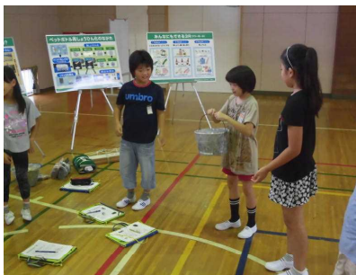
【家庭ゴミの量と重さを体感】