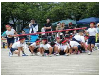
【クルクル・タイフーン】