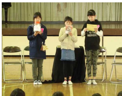
【記念イベントの紹介】