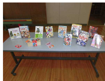
【オススメ本のコーナー】