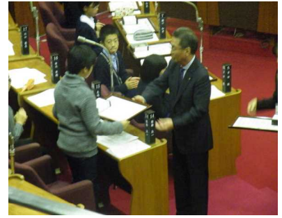
【市長から感謝状の贈呈】