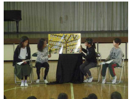
【大型絵本読み語り】