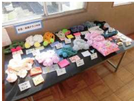
【手芸・料理クラブの作品】