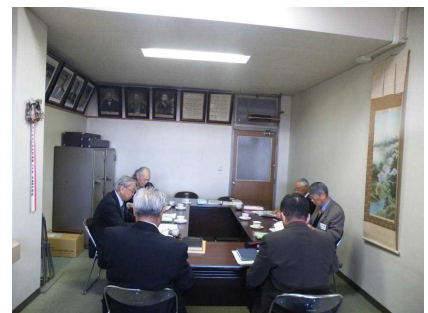
【校長室で意見交換】