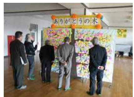
【ありがとうの木の前で】