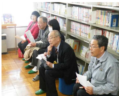
【野間清治顕彰会の視察】