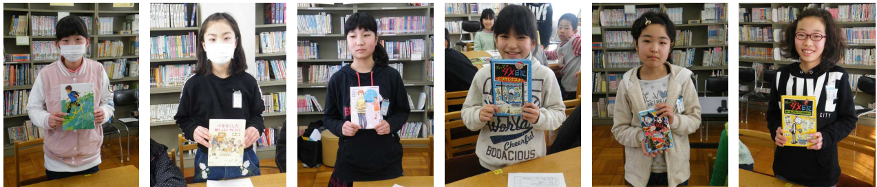
【前半戦のチャンプ本とチャンプ6名を紹介します！】