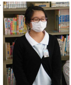
【後半戦のチャンプ】 プレゼンの上手さにみんなが拍手