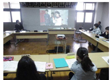
【児童保健委員会の作品紹介】