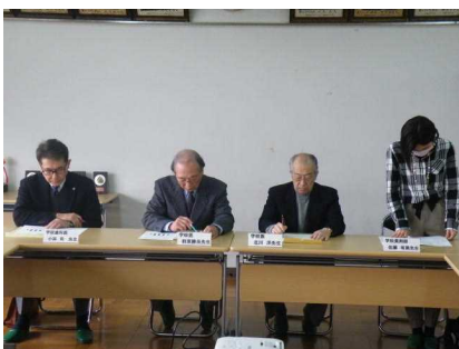
【指導助言者の先生方】