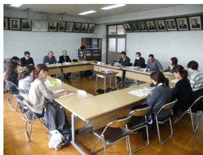
【協議・報告の様子】