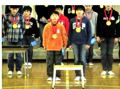
【6年生代表あいさつ】