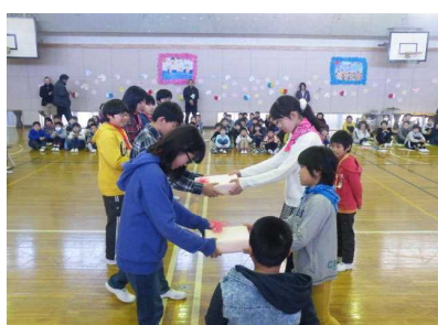
【プレゼントの贈呈】