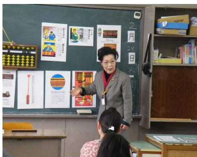
【世界のそろばんについて】

この学習に3単位時間が割り当てられていますが、その真ん中の1単位時間について指導していただきました。