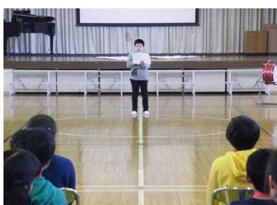
【在校生代表あいさつ】

「送られる側」として最初で最後の6年生を送る会 … 小学校生活の思い出の一つに！