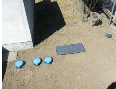
【プール配水管の取替工事】