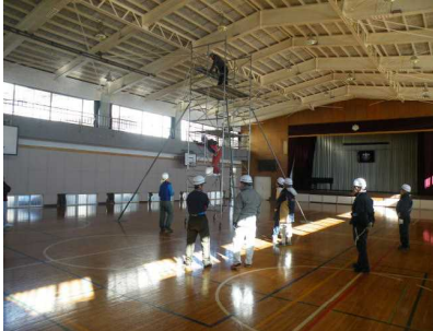
【体育館天井の電球交換作業】