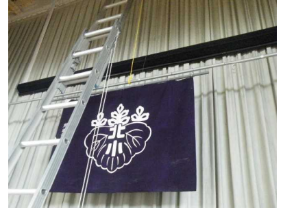
【校旗掲揚バーの補強工事】