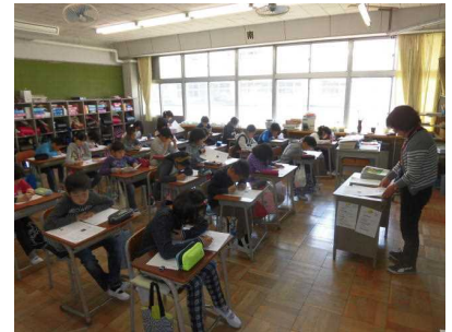
【応用問題に挑戦する4年生】

なお、<学習コンテスト>については、これまで<学びウィーク>最終日の金曜日に実施していましたが、第2回学校評価でいただいた意見(金曜日の家庭学習までしっかりと取り組ませた方がよい)を踏まえて、週明け早々に実施する形に変更しました。