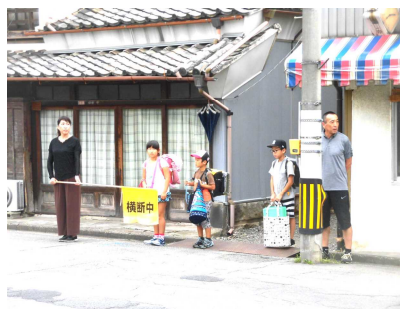
【本町通り北小入口】