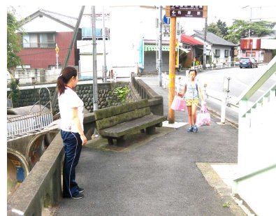
【山手通り西門付近】