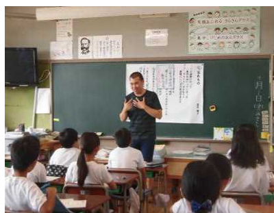
【自己紹介する□□□先生】

□□□先生に替わる新しいALTとして、□□□先生が9月1日(金)に着任しました。 梅田中を中心に、梅田南小と北小の英語活動を担当することになっています。 □□□先生は、アメリカ合衆国カリフォルニア州出身の男の先生で、大学での専攻は東アジア研究だそうです。 既に中之条町で2年間ALTの経験があり、日本語もペラペラで、日本食は何でも食べられるということです。 コミュニケーションがとりやすいと思いますので、児童の皆さんは、□□□先生に日本語や英語でたくさん話し掛けてみましょう。