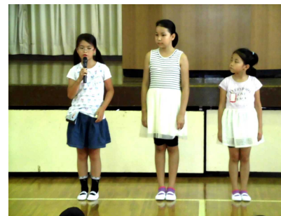
【みんなの前で自己紹介】