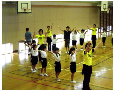
【輪になったの踊り】

講師の動きを真似しながら一人一人が一生懸命練習したので、初めての1年生も、何回か踊るうちには段々と格好がつかってきて、踊り楽しくなってきました。 これからも担任の先生と一緒に練習を重ねていきますので、保護者の皆さんは、運動会当日の買場紗綾市音頭の踊りを楽しみに待っててください。