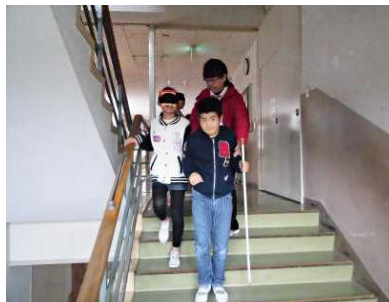
【階段でブラインドウォーク】