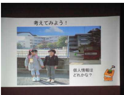
【この写真に個人情報はいくつある?】