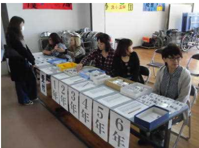
【P T A役員による受付】

なお、20名の方々から頂戴しました『来校者アンケート』にありました課題(2点)につきましては、検討していきたいと考えています。ありがとうございました。