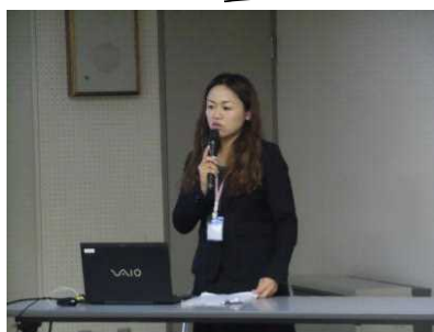
【小中学生の子どもをもつお母さん】