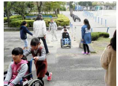
【屋外で車椅子を押す】