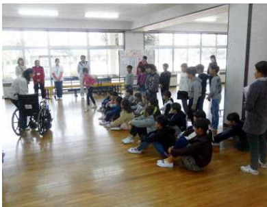
【車椅子の扱い方を聞く】

これは、総合的な学習の時間の単元：『いろいろな人と心を伝え合おう(福祉)』で、「障害について理解し、障害者と共に生きることの大切さを知り、自分にできることを考えることができる」という目標を達成するために取り入れた体験活動で、「車椅子体験(操作する、押す、乗る)」とアイマスクや白杖を使った「視覚障害(ブラインドウォーク)体験」を行い、車椅子に乗った人への介助の仕方、目が不自由な人のへ介助の仕方を体験的に学習しました。