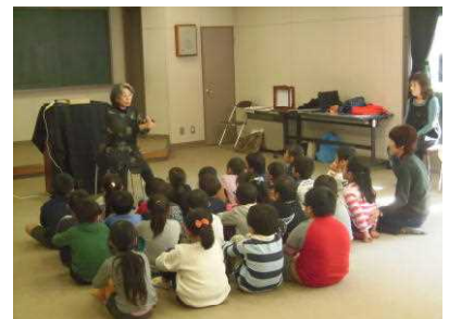
【民話を聞こう(1年生)】