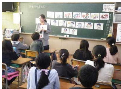
【自分の気持ちを伝える表現は?】