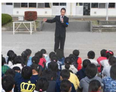
【スクールサポーターの話】

対処するうえでの基本は、「イカのお寿司の対応=いか(行かない)、の(乗らない)、お(大きな声を出す)、す(すぐに逃げる)、し(警察・学校に知らせる)」で、「腕を掴まれたら、すぐに振り払って、20m以上走って逃げる。」「危ないと思ったら、大声とともに防犯ブザーや笛を鳴らす。」「素早く、最寄りの家に駆け込む」の3つが重要です。