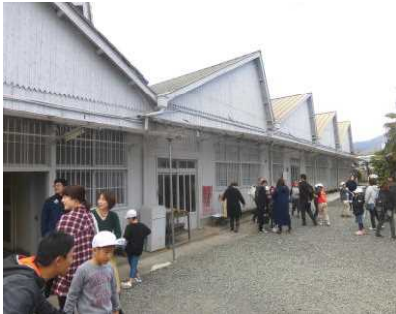
【2グループに分かれて見学】