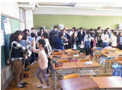
【参観者とコミュニケーション活動】

来年度は、新学習指導要領の移行措置期間に入りますが、北小でも英語活動と英語科については着実に準備を進めていきたいと考えています。