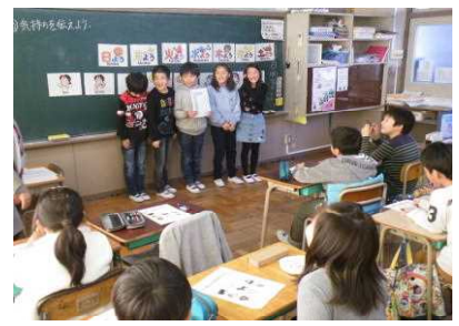
【ボンゴになった人が質問に答える】