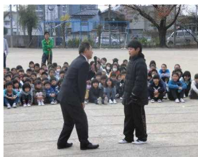
【車に乗って道案内してくれる?】