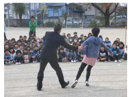
【モデルになるための写真撮らない?】