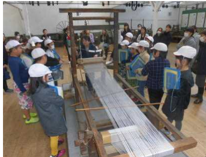
【手織りの様子を親子で見学】