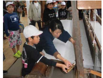
【杼(ひ)を動かして織ってみました】