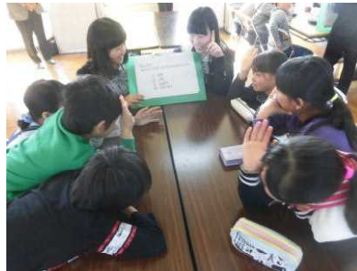
【リケジョ2名が問題の解説】