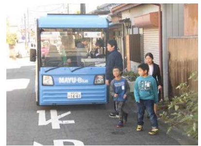
【勉強したMAYUに試乗しました】