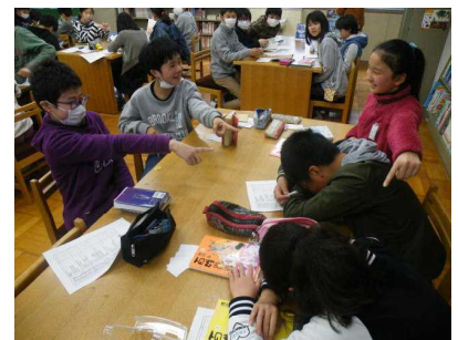
【“せえーの”で決戦投票】