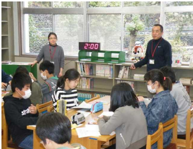
【持ちタイムは2分ですよ】