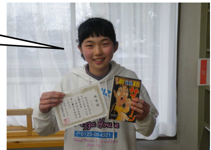
【ビブリオバトルチャンプの認定証とチャンプ本を手に記念撮影】

発表する時はちょっと緊張したけれども、ビブリオバトルはとても楽しかったです。 “チャンプ本の中のチャンプ本”に選ばれ、たいへん嬉しい気持ちでいっぱいです。 どうもありがとうございました。