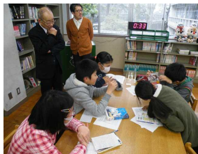
【発表を真剣に聞いています】