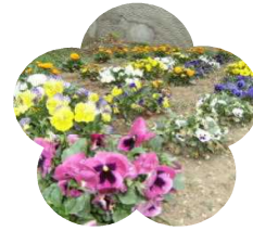
(校門前のパンジー)

4月23日(月)と24日(火)の2日間で行われました授業参観では、多くの保護者の方に来校して頂き、ありがとうございました。また、新年度にあたり、役員などの組織の決定につきましても、大変お世話になりました。なお、1年生の授業参観・懇談会は、5月10日(木)となりますが、よろしくお願ひ致します。