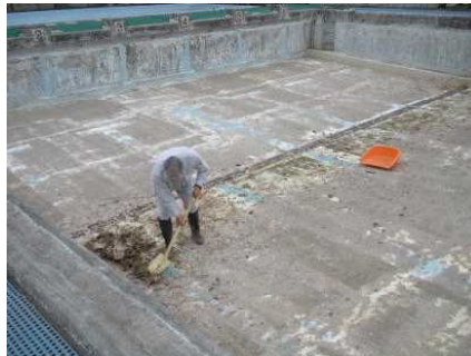
大プールの汚泥や枯れ葉を、用務員さん達が除去