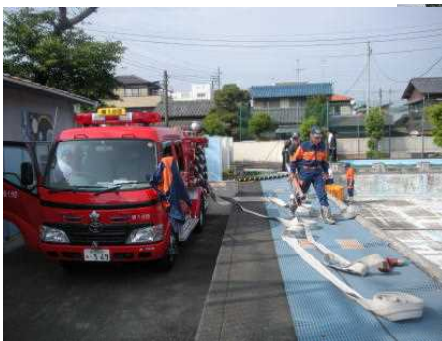
消防10分団の方々が消防車で駆けつけ放水