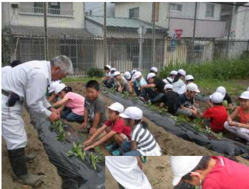
2年生 サツマイモ の苗植え

北小学校の理科園では、それぞれの学年の学習教材がたくさん植えられています。先日は2年生がサツマイモの苗を植えました。その他にも、6年生の教材でもあるジャガイモやつくし学級の子もたちが植えた、ナスやピーマン、キュウリなど実のなる植物が沢山植えられています。いつも、花壇の整備や草むしりをしてくださる用務員さんのおかげで沢山の植物が生き生きと育っています。時々、北小理科園に足を運んで観察してみてください。