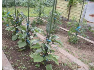
ナス(上) ジャガイモ(下)