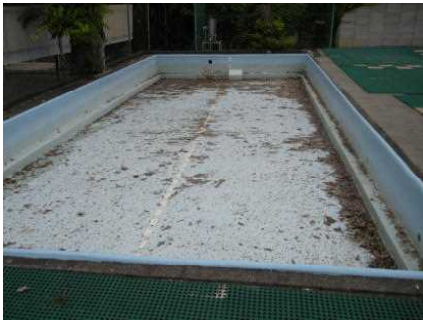
水を抜いた後の小プール

お陰様で、今年も北小のプールから、北小っ子の元気な声が聞こえてきそうです。安全に気を付けて楽しく水泳の学習が行えるよう指導したいと思います。