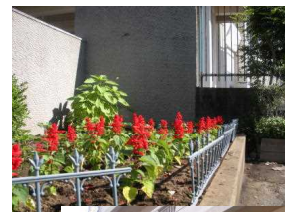
←校門前 ハンジーから サルビアの花に

6月29日に「梅雨明け」という気象庁からの発表がありました。6月の梅雨明けは初めてだそうです。これまでに関東甲信越地方で最も早く梅雨明けしたのが7月1日だということです。 気温と湿度の高い天候が続きますと、熱中症が心配されます。水筒と汗ふきタオルは、毎日、忘れずにお子さんに持たせてください。また、プールに入れる日も多くなりますので、ご家庭で朝の健康観察をしっかりとってください。そして、体調の悪い時は、必ず担任へ連絡をお願いいたします。 学習面でも、一学期のまよめの時期になりますので毎日元気に登校出来ますよう、お子さんの健康管理をよろしくをお願いいたします。