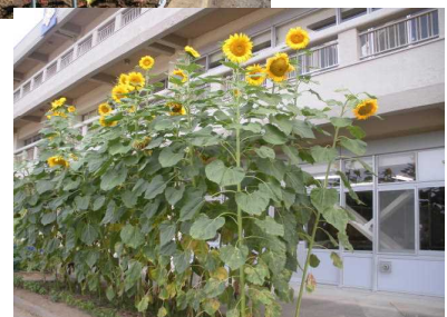
ひまわりの背の高さに夏を感じます・・・