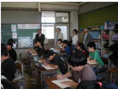
↑ 5年生の 授業参観