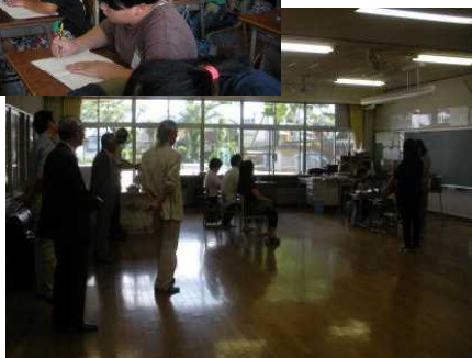
つくし学級の授業参観

6月20日(水)に1・2・3年生が、22日(金)に4・5・6年生・つくし学級の授業参観及び懇談会が行われ保護者の皆様には、大変お世話になりました。