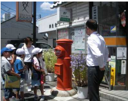
【桐生本町二丁目郵便局】