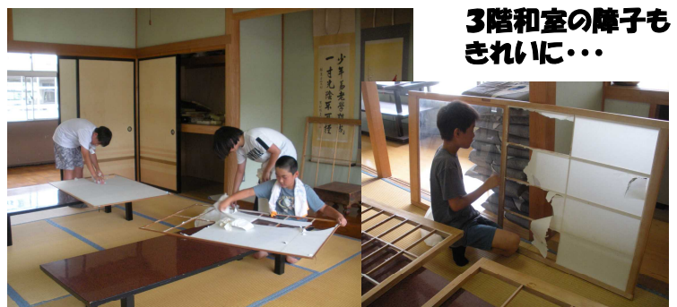
3階和室の障子もきれいに...

7月17日(火)の第5校時に、全学年で学期末の大掃除を行いました。 普段の清掃ではなかなか手が入らない場所(サッシの溝、流し、傘立て、トイレ、ベランダなど)を、特に念入りに掃除し、汚れのひどい所は適宜水拭きをするとともに、清掃用具入れの整頓も行いました。