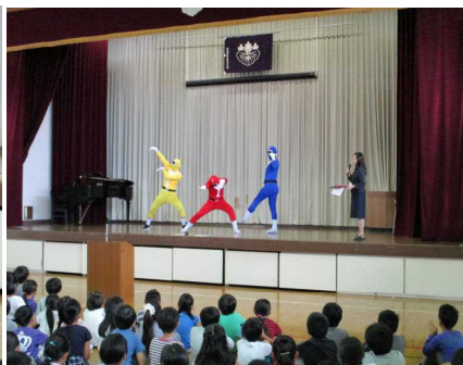
【北小レンジャー登場】