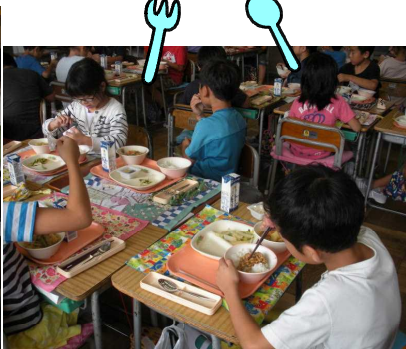
【2年生の給食の様子】