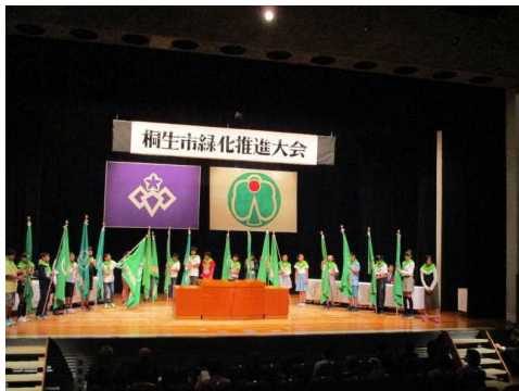
【誓いの言葉の提唱】