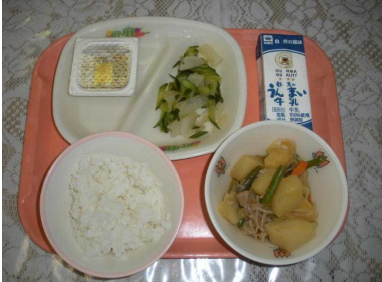
【納豆、肉じゃが、さっぱり漬、ごはん、牛乳、】