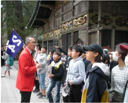
←日光で説明を聴く6年生