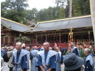
↓秋の大祭で千人行列の出番を待つ人達

先週の17日18日19日と下記の表の通り、秋の校外学習に行ってきました。どの学年も、楽しい学習を体験することができたようです。特に、6年生にとっては、小学校最後の校外学習でした。世界遺産の日光東照宮では、歴史を体感して行くことができました。この日秋の大祭の2日目で、東照宮は大変混雑していましたが、残念ながら行列は見学できませんでしたが、行列前それぞれの衣装を身につけた人達の様子を見ることができました。