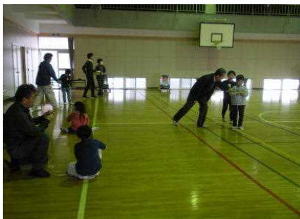
【コマ・竹とんぼ・けん玉】