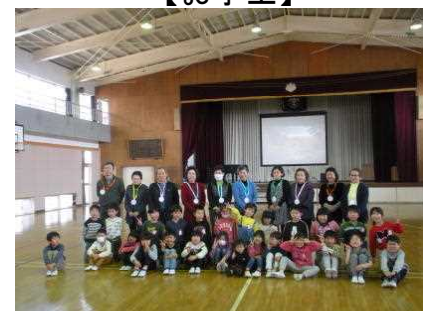
【最後にみんなで集合写真】