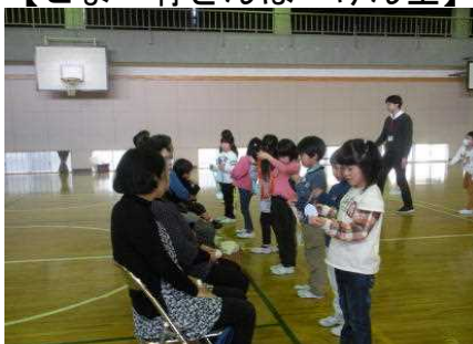
【メダルをプレゼント】