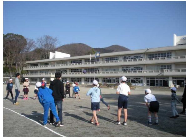
【みんなで楽しくドッジボール】