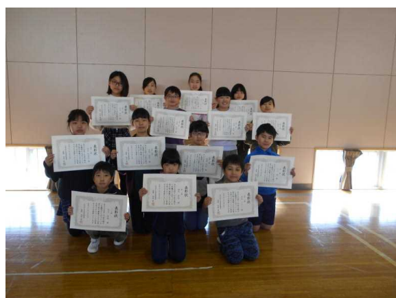
【表彰後に記念撮影】