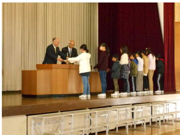
【表彰を受ける児童】