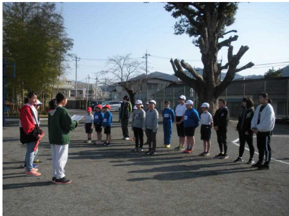
【ルールの説明をする5年生】

3月12日(火)の朝行事で、今年度最後のたてわり活動を行いました。 今回は、5年生が計画準備を担当し、たてわり活動においては、いよいよ6年生からのバ トンを引き継ぎました。少し緊張して、慣れない様子でしたが下級生の前に立ち、しっか りした態度で活動の内容やルール説明などを行うことができました。 来年度、5年生が最上級生として活躍する姿が今から楽しみです。