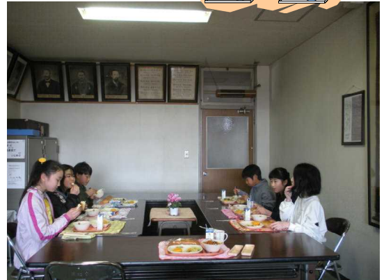
【どの班も楽しく会食】