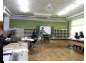
【先生方の授業研究会の様子・みんなで交流し考えを深めます】