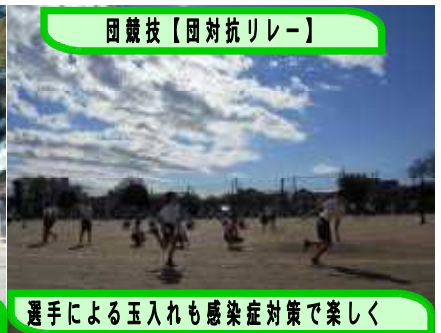
選手による玉入れも感染症対策で楽しく

⊗上記の他、実施できました全ての種目で、元気いっぱいの子供たちの姿がみられました。この成果を日々の学習・生活に生かし、これからも157名皆で成長し続けていけるように願ってやみません。これからも、引き続きご協力のほどよろしくお願いいたします。