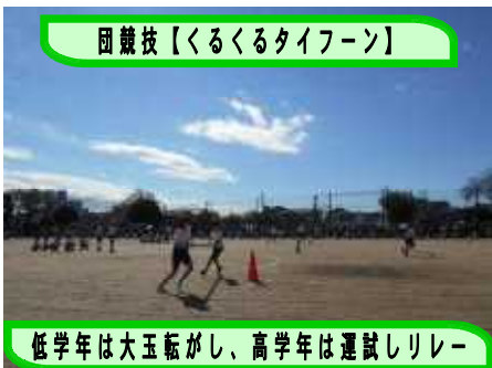
低学年は大玉転がし、高学年は運試しリレー