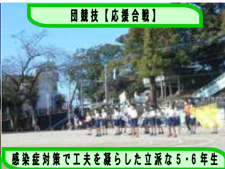
感染症対策で工夫を凝らした立派な5・6年生