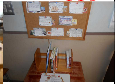
今月のおすすめ本のコーナー