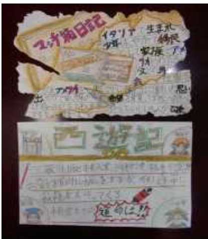
北小読書週間ポップ作りの作品より