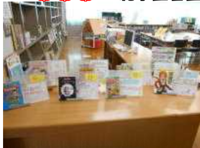
ポップ作り完成作品の展示