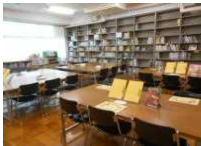
読書感想文代表作品展示