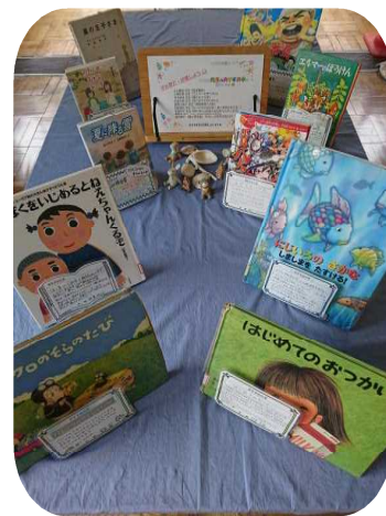
おすすめの本のメッセージは 北小っ子通りに提示中